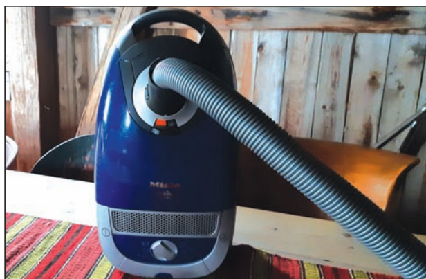
Jeg trenger en «fører»