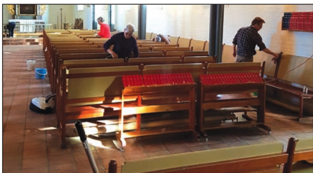
Her blir Hole kirke ren og pen....

Er vi heldige blir det kaffe og kaker i pausa.