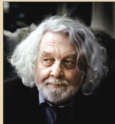
Forfatter Edvard Hoem

Vi har gledet oss i mer enn et år til at forfatter Edvard Hoem skulle komme på besøk til Hole kirke på salmekveld i april, og både koret DaCapo og Ringerike mannskor har øvd og forberedt seg lenge. På grunn av usikkerhet rundt korona-smitte og hvor lenge unntakstilstanden varer, har vi i samarbeid med forfatteren besluttet å flytte arrangementet til høsten 2020. Nærmere dato vil bli kunngjort på vår hjemmeside www.kirken.no/hole og i neste nummer av Holeposten. Kulturarrangementer planlegges gjerne lang tid i forveien, særlig hvis man skal ha tak i personer som er etterspurte. Da vi inngikk avtalen, hadde vel ingen hadde tenkt seg en slik situasjon som vi er i nå, med lukkede dører og uten mulighet for å samles.