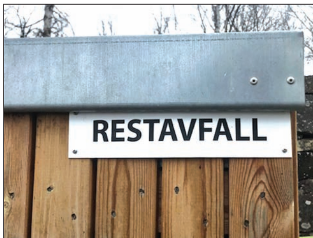
Restavfall BARE til avfall som IKKE skal tilbake i jorda