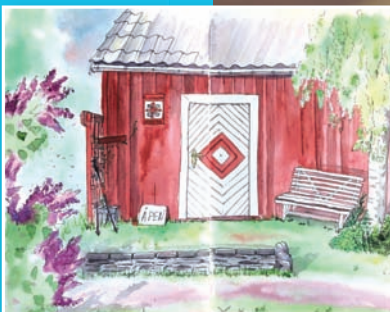
Pilegrimen Tbazko la igjen tegningen sin av Skomakerstua