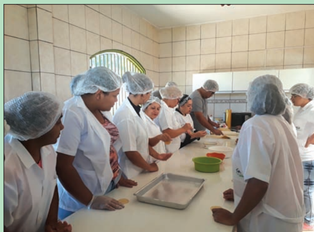
Kurs i husstell og matlagning