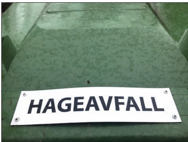
Denne brukes BARE til hageavfall som skal tilbake til jorda