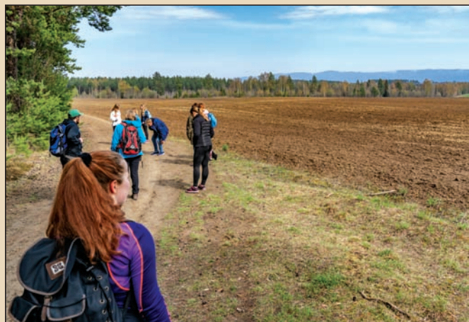
På pilegrimsleden langs jordene til Mo gård

Med forbehold om endringer se: www.kirken.no/hole