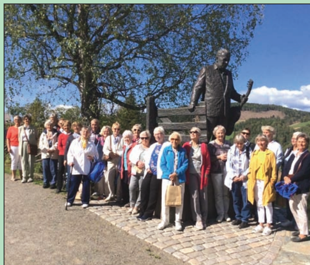
Sanitetskvinner på sommertur til Alf Prøysens rike i 2019