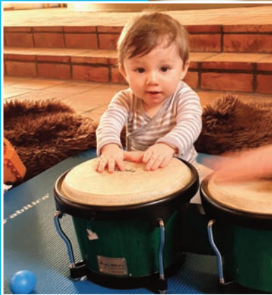
Babysang i Hole kirke